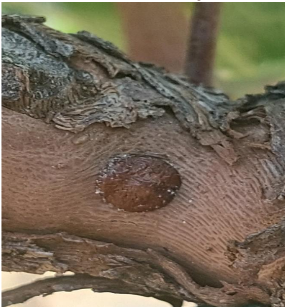
3. Cocciniglia del coriolo