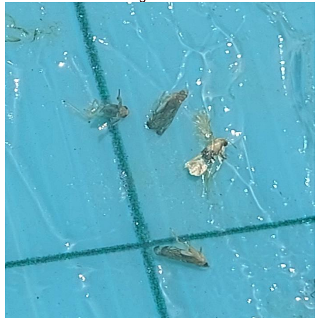
4. Scafoideus titanus