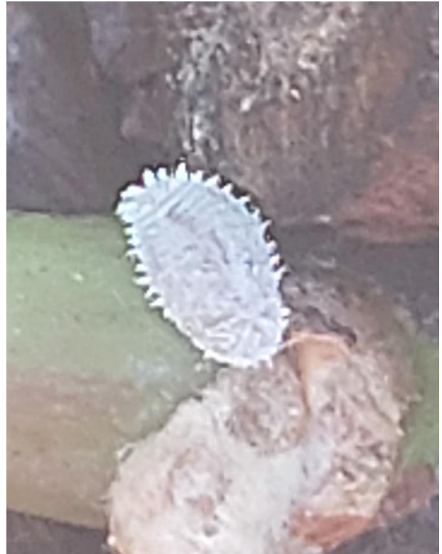
2. Cocciniglia farinosa