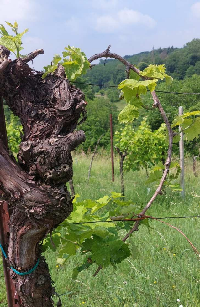
1. Flavescenza dorata