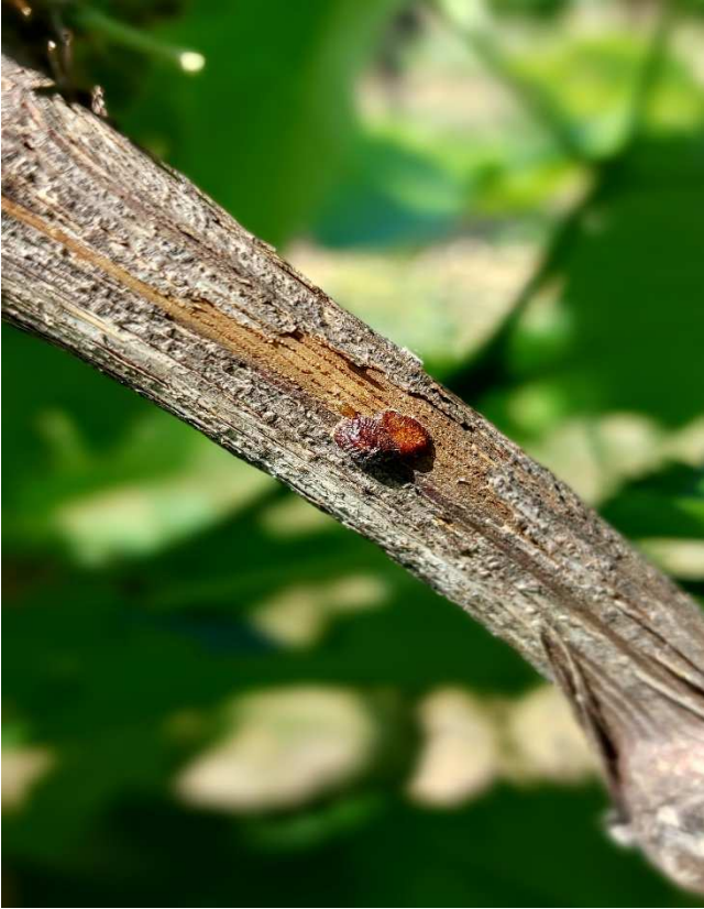
3. cocciniglia del corniolo