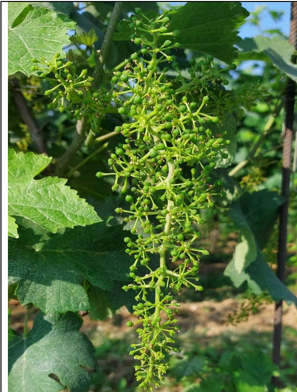
1. Inizio allegazione