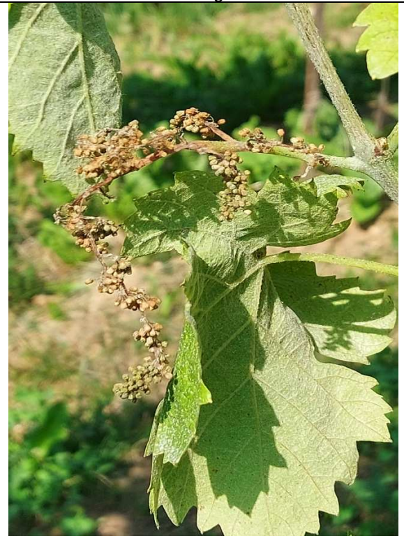
4. Flavescenza Dorata