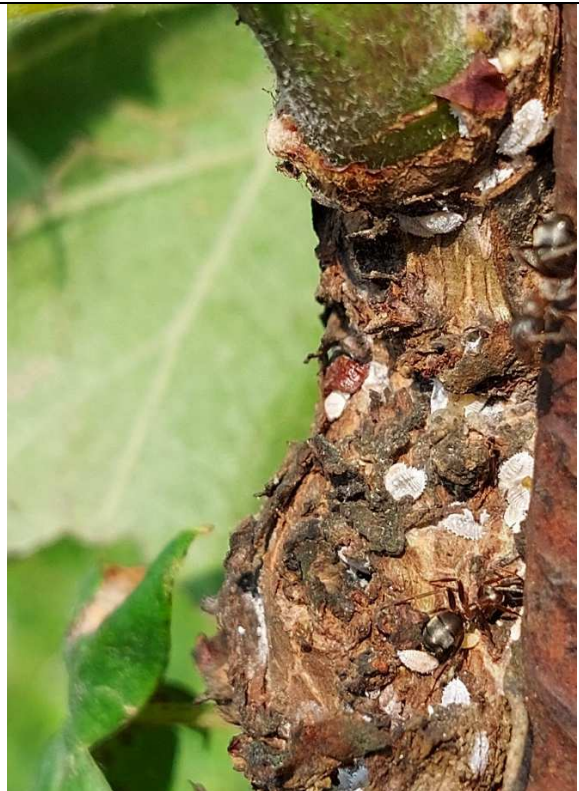
2. Cocciniglia Farinosa